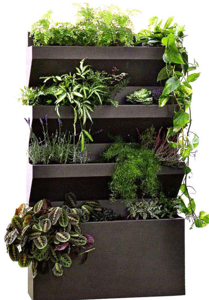
Etagere, дизайн Germain Bourre