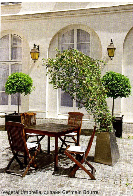
Vegetal Umbrella, дизайн Germain Bourre