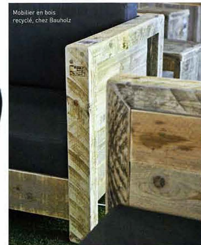
Mobilier en bois recyclé, chez Bauholz

en vogue, et qui se patine grâce à un alliage formant une couche protectrice à sa surface. Dans ce même esprit, le style « grillage » a aussi de beaux jours devant lui, décliné en paravents, brise-vues, porte-pots, fauteuils et canapés ou pergolas. Son côté graphique allié au métal est la parfaite union entre l'aspect contemporain et un matériau classique utilisé depuis des lustres. Les fers à béton que l'on propose pour l'aménagement des potagers entrent dans cette catégorie.