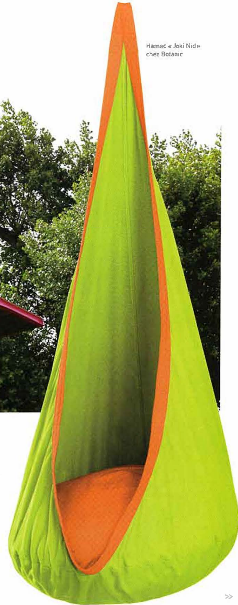
Hamac « Joki Nid » chez Botanic

La seconde tendance qu'elle décrypte est un net intérêt pour le style industriel, qui déjà pointait le nez dans l'aménagement intérieur. Aujourd'hui, l'intérieur et l'extérieur se mêlent de plus en plus, les meubles outdoor investissent le salon et la cuisine s'exporte dehors. Tous les espaces garnis de béton, indoor et outdoor, offrent donc naturellement un terrain privilégié pour les objets et meubles en acier tonillé comme l'acier Corten, très