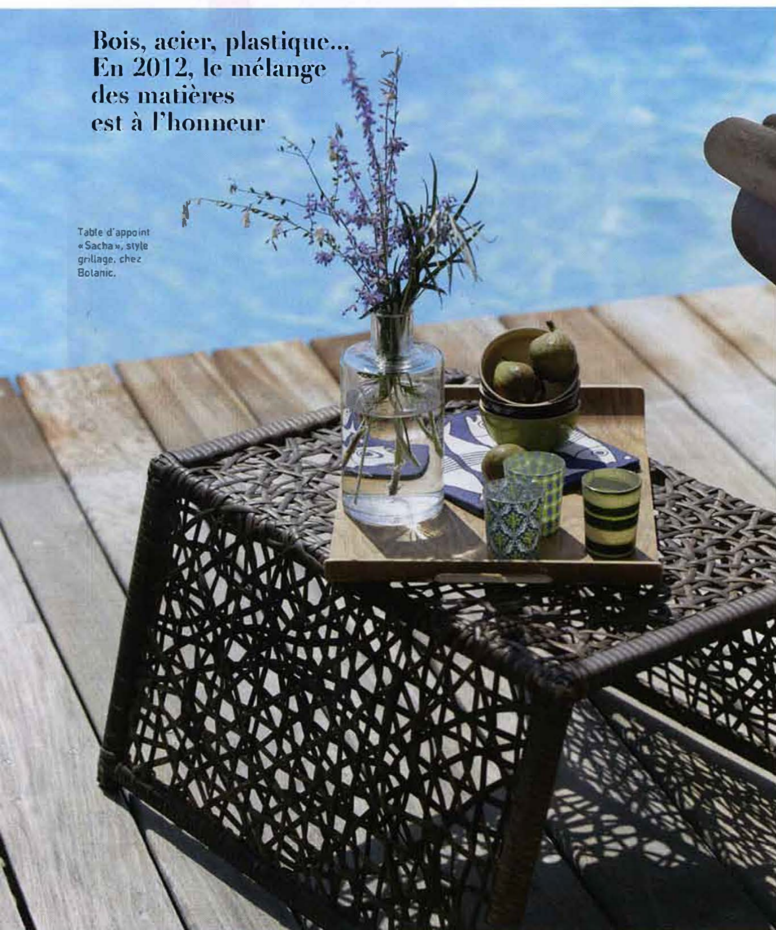
Table d'appoint « Sacha », style grillage, chez Botanic.