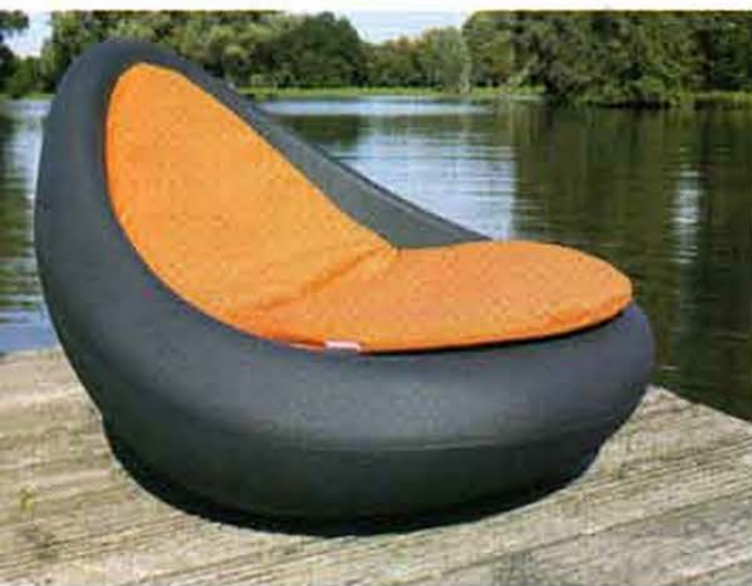
Assise de la collection « zzen » par Niels de Greef