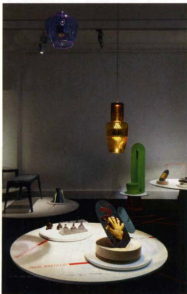
Exposition des premières pièces de Particule 14 au Lieu du Design.