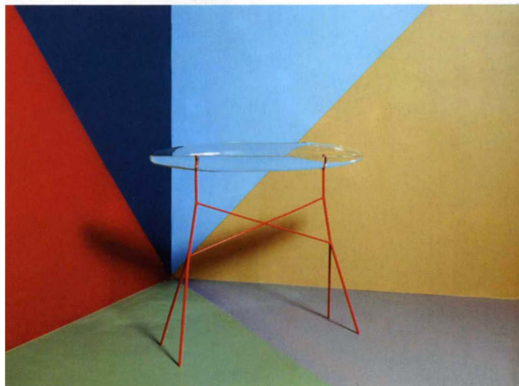
Table Aquarium Air 2 d'Amaury Poudray.